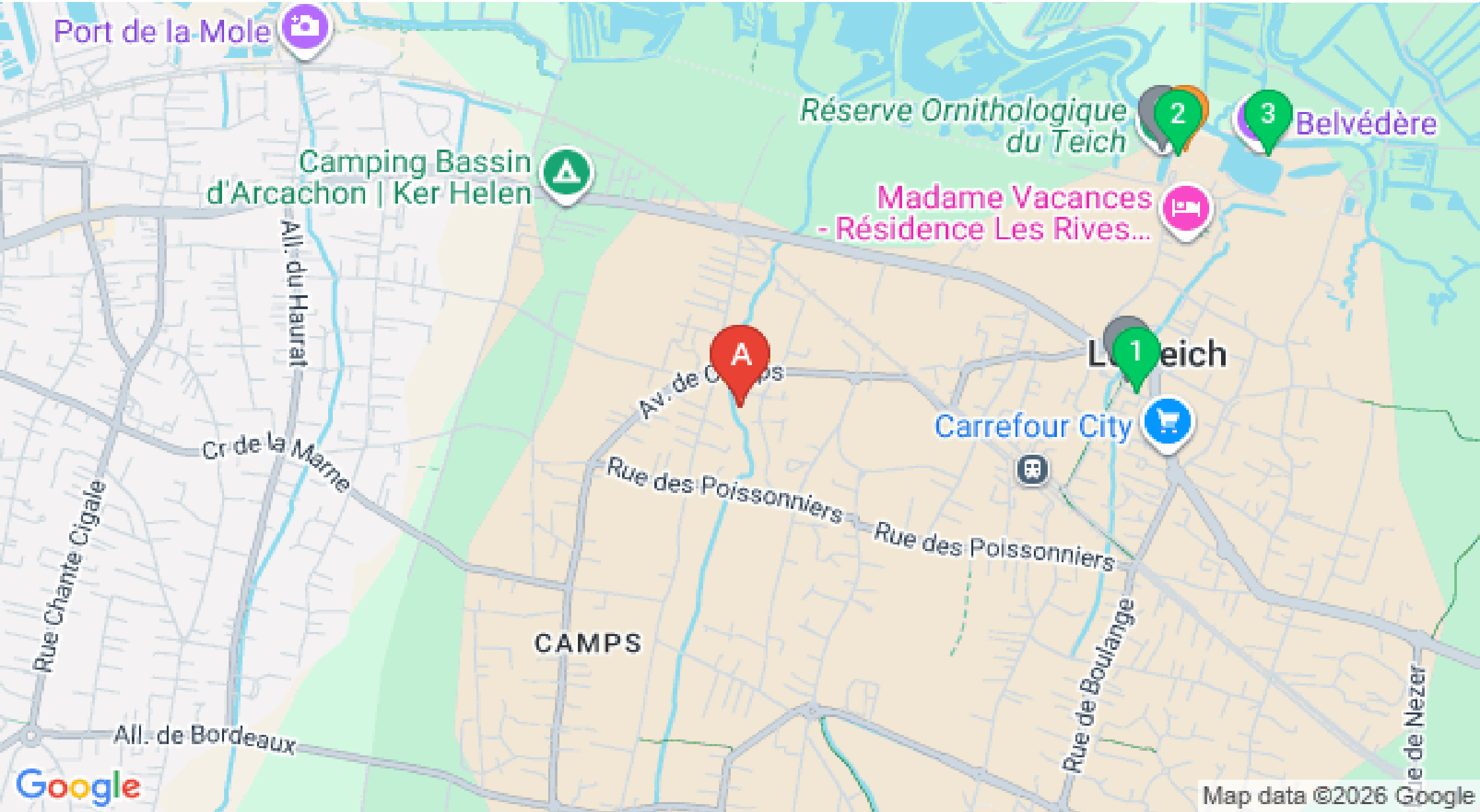
Map data ©2026 Google